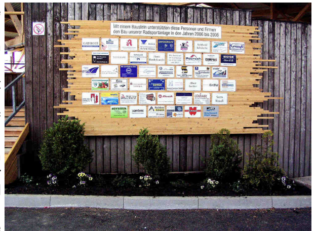
Bausteinspendertafel im Eingangsbereich

PS: Den Mitgliederbrief mit farbigen Bildern finde sie als Datei auf unserer Internetseite.