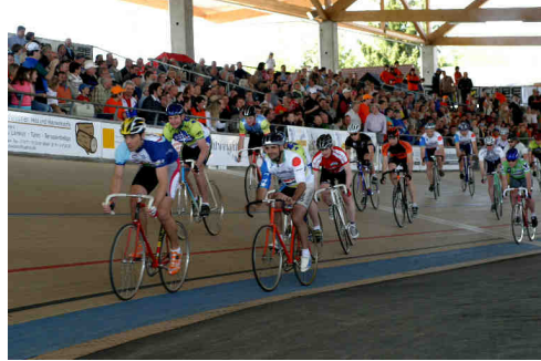
Rennen der Ehemaligen