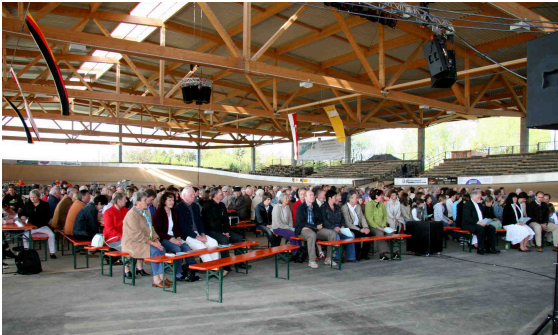
Gottesdienst im Radoval

verein Öschelbronn ausgezeichnet gestalteten. Das anschließende Frühschoppenkonzert brachte nochmals Stimmung ins Radoval. Gleichzeitig fand in der Bürgerhalle der ascent-Cup im Kunstradfahren statt.