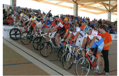
Start des Profi-Ausscheidungsrennen