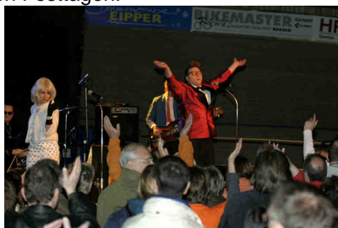
02.05. Konzert - hier die Gruppe Wirtschaftswunder