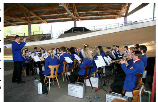
04.05. Musikverein Öschelbronn